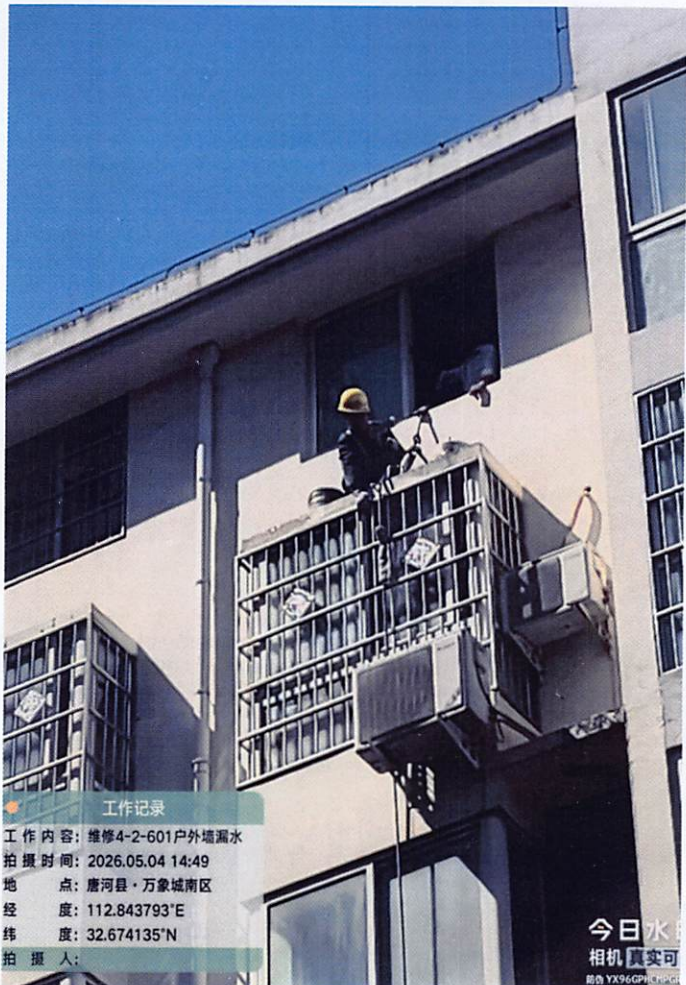
● 工作记录 工作内容: 维修4-2-601户外墙漏水 拍摄时间: 2026.05.04 14:49 地点: 唐河县·万象城南区 经度: 112.843793°E 纬度: 32.674135°N 拍摄人: