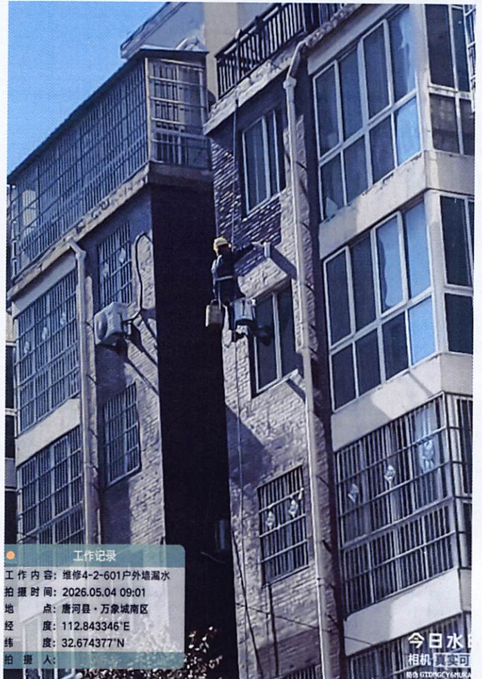
● 工作记录 工作内容: 维修4-2-601户外墙漏水 拍摄时间: 2026.05.04 09:01 地点: 唐河县·万象城南区 经度: 112.843346°E 纬度: 32.674377°N 拍摄人: