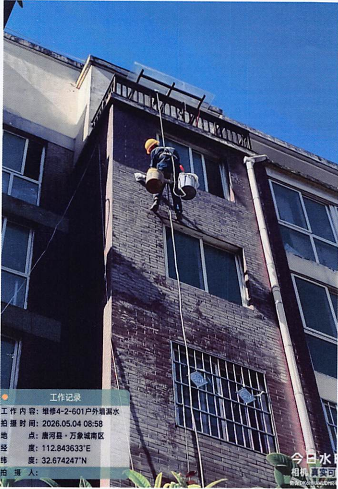
● 工作记录 工作内容: 维修4-2-601户外墙漏水 拍摄时间: 2026.05.04 08:58 地点: 唐河县·万象城南区 经度: 112.843633°E 纬度: 32.674247°N 拍摄人: