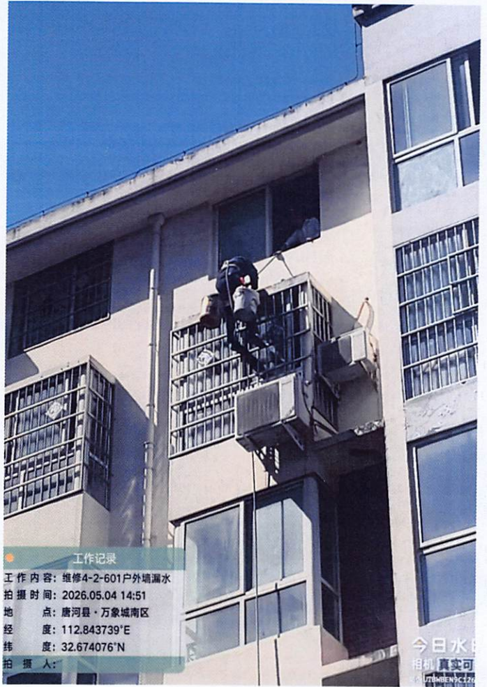
● 工作记录 工作内容: 维修4-2-601户外墙漏水 拍摄时间: 2026.05.04 14:51 地点: 唐河县·万象城南区 经度: 112.843739°E 纬度: 32.674076°N 拍摄人: