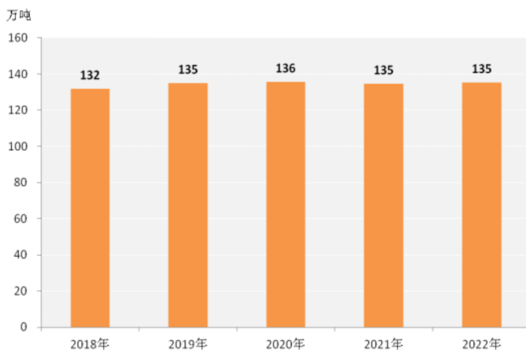
图 3 2018-2022 年唐河县粮食产量

种面积 213.44 万亩；秋粮播种面积 131.66 万亩，其中稻谷、玉米、豆类、薯类（折粮）播种面积分别为 7.17 万亩、100.08 万亩、10.4 万亩和 12.55 万亩。油料种植面积 94.56 万亩，蔬菜及食用菌种植面积 32.75 万亩。全年粮食总产量 1353608 吨，其中夏粮总产量 986870 吨，小麦总产量 986855 吨；秋粮总产量 366738 吨。油料、蔬菜总产量分别达到 272985 吨、909579 吨。当年生猪存栏 81.58 万头，出栏 123.48 万头，猪肉产量 90900 吨，牛存栏 17.11 万头，出栏 12.47 万头，牛肉产量 18700 吨，羊存栏 40.10 万只，出栏 41.09 万只，羊肉产量 4900 吨，家禽存栏 838.66 万只，出栏 546.34 万只，禽肉产量 7300 吨，禽蛋产量 54600 吨，全年肉类总产量 121800 吨，奶类产量 25900 吨。