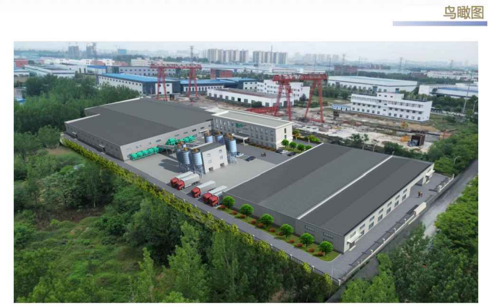
唐河县信达建材有限公司 Tanghe Xinda Building Materials Co., Ltd. 年产20万方预拌混凝土建设项目