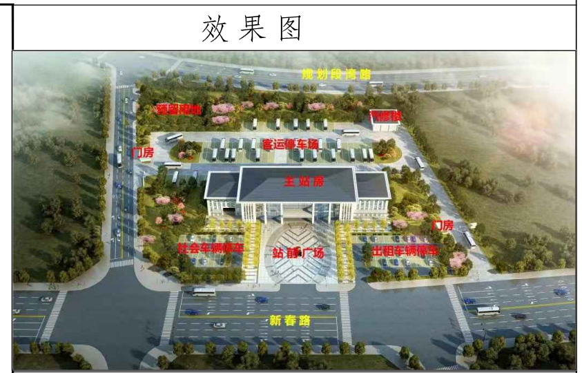
新春路东侧、段湾路西侧、规划18米道路南侧地块（唐河县交通运输局唐河县城城区客运南站工程建设项目）规划控制图